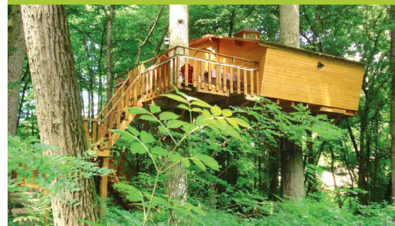
CABANES DANS LES ARBRES - ROULOTTE - YOURTE